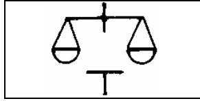
A T betű hármass jelentése